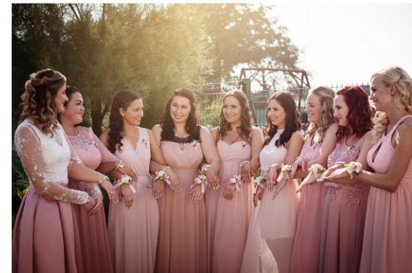
FOTOGATELIER EKRAKT DIFFERENT LOOK